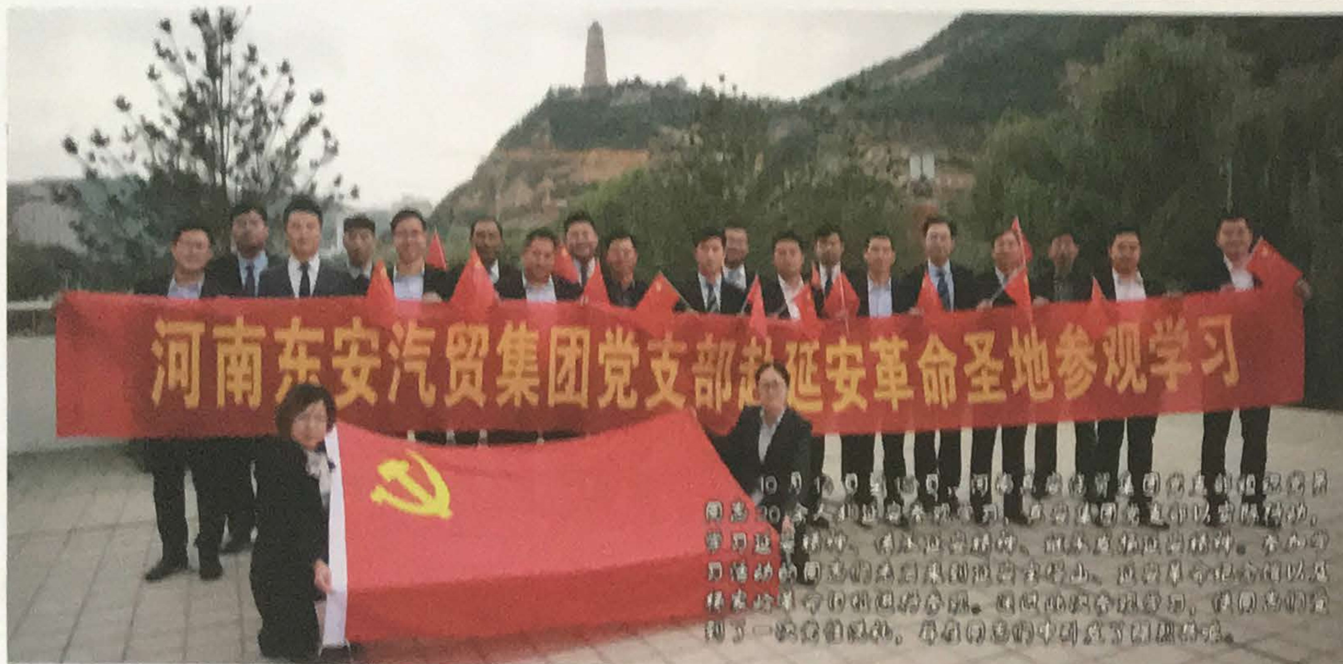
10月18日，河南东安汽车贸易集团党支部组织党员干部20余人赴延安革命圣地参观学习。在延安革命纪念馆，大家认真聆听讲解，重温革命历史，感悟革命精神。在枣园革命旧址，大家参观了毛泽东同志的故居，感受了老一辈革命家的革命情怀。在宝塔山下，大家合影留念，纷纷表示要继承和发扬党的优良传统，为东安集团的发展贡献智慧和力量。